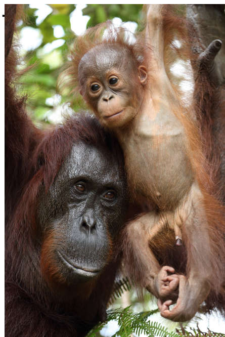
(表紙+上記2枚の写真/前川先生撮影)