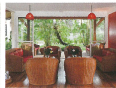
Croix du Sud