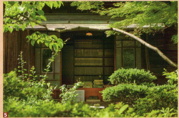
1 明治村大賞「夕映えの聖ヨハネ教会堂」梅田光興 2 明治のある風景賞 特賞「西郷邸の夕焼け」二村研次 3 ハクバ写真産業賞「色への憧れ」横座アリス 4 フェスティバル賞 特賞「和傘物語」新田博之 5 坂の上の雲ミュージアム賞「先生、おじゃましますよ」大藪紗希(敬称略) ※写真は前回入賞作品の一部です。