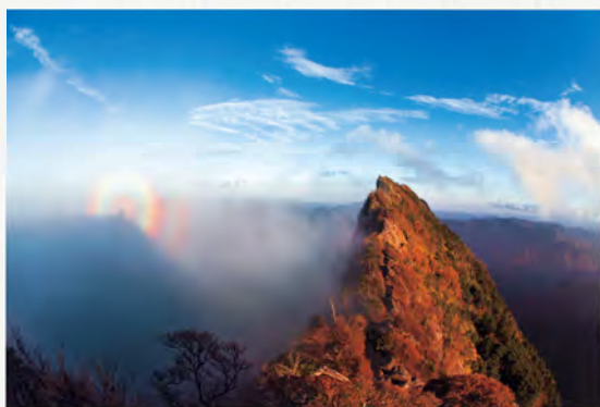
第36回プリント部門 最優秀賞 『我、虹の中に』北村健三