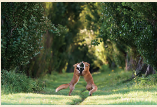
第35回 デジタル部門 最優秀賞ソニー 4K賞『朝稽古』大野泰之