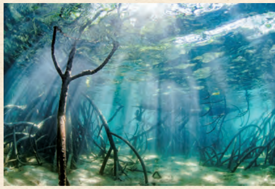
第35回 プリント部門 中村征夫賞『光芒』今尾祐子